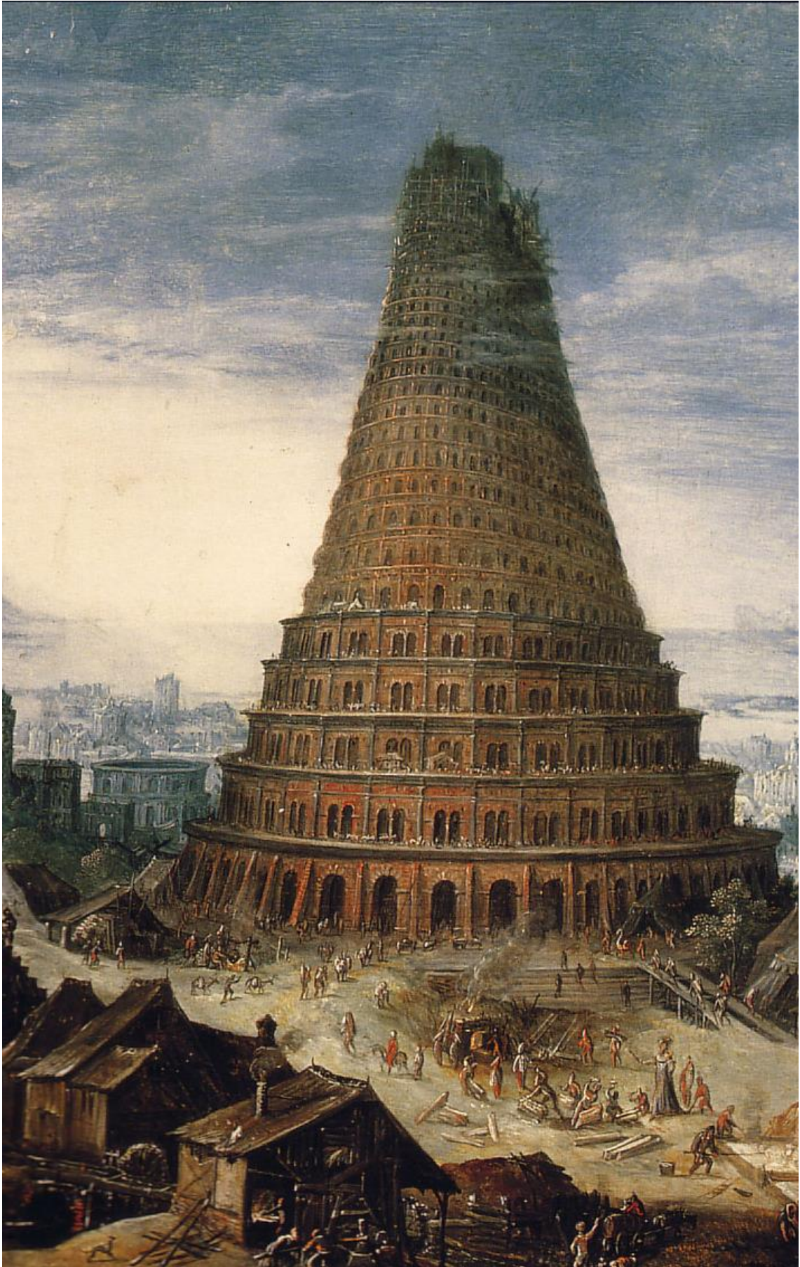
TORRE DE BABEL.